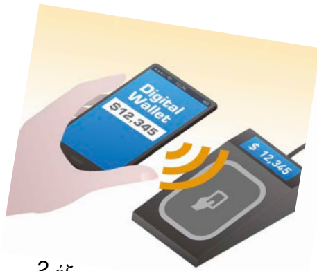
2 έξυπνη πληρωμή