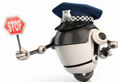
6 ρομπότ αστυνομικός