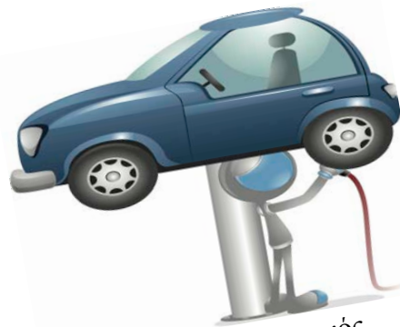
9 ρομπότ μηχανικός