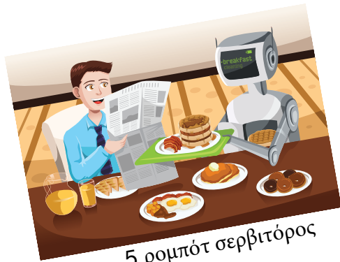
5 ρομπότ σερβιτόρος