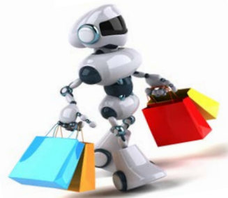
4 ρομπότ ψωνίσματος