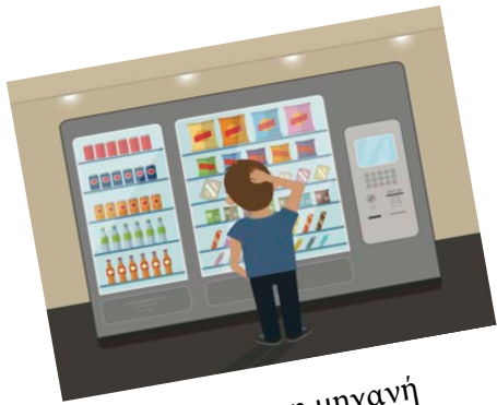
1 αυτόματη μηχανή

ΟΔΗΓΙΕΣ: Γράψε ένα πλεονέκτημα και ένα μειονέκτημα για κάθε εικόνα.