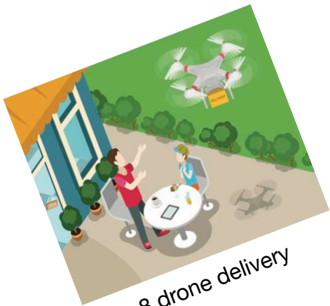
8 drone delivery