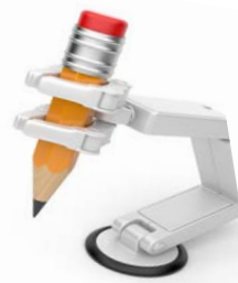
3 μολύβι ρομπότ